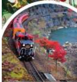
รถไฟฮารายาชิ