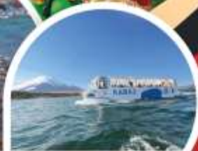
รถเล่นน้ำทะเลกินตก