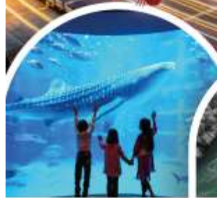
พิพิธภัณฑ์สัตว์น้ำไคยูกัง