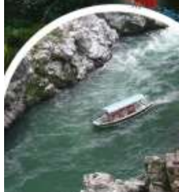
ล่องเรือใบแม่น้ำซ่องเขาโคโนะ