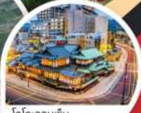
โตโกะออนเซ็น