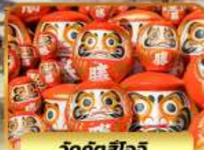
วัดค้ดล้ไอจ้