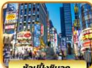
ช้อบบ้งชินจูกุ