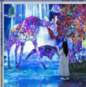
"TEAM LAB FOREST"