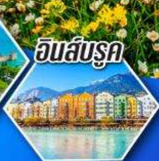
อินส์บรุค

พืชดอกยามโดโลไมท์ แบบเต็มอิ่ม พร้อมค้างคืน ที่เมืองโบลซาโนในเขตดอกยาม