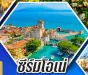
ซีร์มิโอเน่