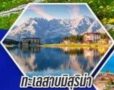
ทะเลสาบมิสุร์น่า