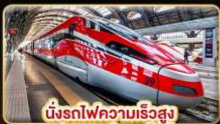
นั่งรถไฟความเร็วสูง ฟลอเรนซ์ - นาโปลี