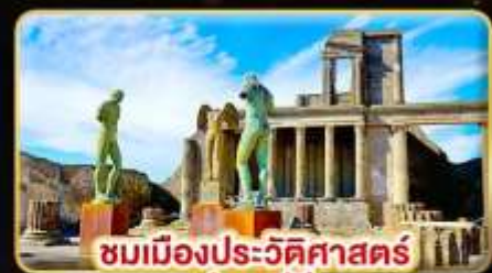
ชมเมืองประวัติศาสตร์ ปอมเปอี