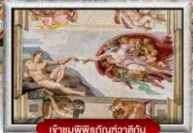
เข้าชมพิพิธภัณฑ์ทิวาติกัน

เมนูพิเศษ! สปาเกตตี้เส้นหมึกดำ, พิซซ่าสไตล์อิตาลีเย็นแท้