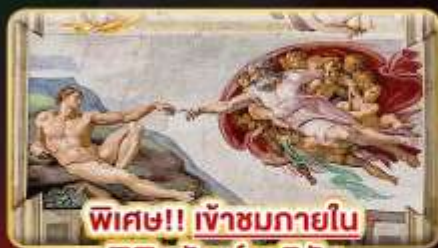
พิเศษ!! เข้าชมภายใน พิพิธภัณฑ์วาติกัน