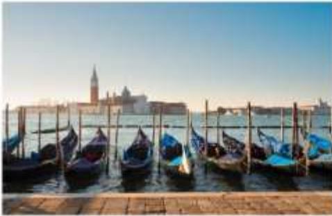
เรือกอนโดล่า

นำท่านออกเดินทางสู่ ท่าเรือตรอนเคโต เพื่อเตรียมตัวนั่งเรือข้ามสู่เกาะเวนิส เกาะเวนิสเป็นดินแดนแสนโรแมนติก เป็นเมืองที่ไม่เหมือนใคร โดยใช้เรือแทนรถ ใช้คลองแทนถนน มีสมญานามว่าเป็น “ราชินีแห่งทะเลเอเดรียติก” มีเกาะน้อยใหญ่กว่า 118 เกาะและมีสะพานเชื่อมถึงกัน กว่า 400 แห่ง