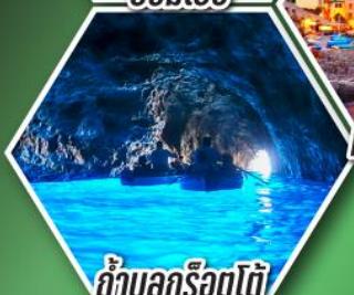
ถ้ำลูกรोटโต้