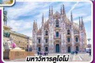
มหาวิหารดูโอโม