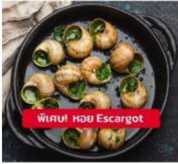
พิเศษ! หอย Escargot