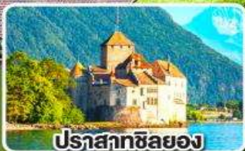
ปราสาทซิลยอง