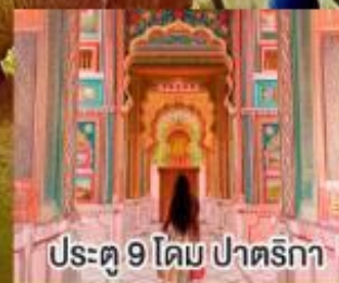
ประตู 9 โคม ปาตริกา