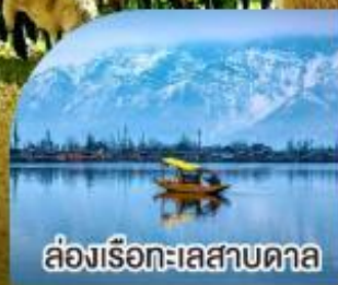
ล่องเรือทะเลสาบดาล