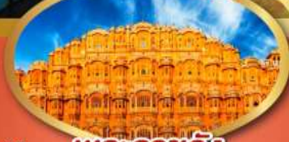
พระราชวัง สายลม