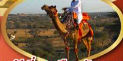
ฟรี ژیออู เมืองมันทอวา ราคาเริ่มต้น