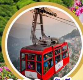
Cable Car กิ่งตอก