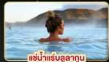
แช่น้ำแร่บลูลาگون