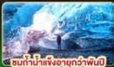
ชมถ้ำน้ำแข็งอายุกว่าพันปี