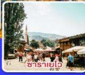
ซาราเยโว