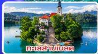
ทะเลสาบเบลด

ไข่มุกแห่งแอเดรียติก พร้อมขึ้นกระเช้า SRD