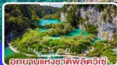
อุทยานแห่งชาติพลิทวิเช่