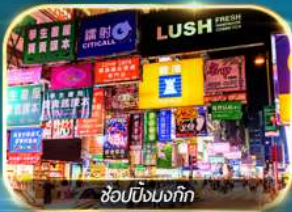
ช้อปปิ้งมงก๊ก

เต็มอิ่มทั้งบุญ และ ช้อปปิ้งแบบจัดเต็ม จิมซาจุ้ย มงก๊ก