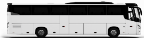
ตัวอย่างรถทัวร์ 1 ชั้น

หากประเภทห้องที่ท่านริเคเวสมาเต็มจาก ก็เช่น ริเคเวสห้องพักเป็น TWIN BED หรือ DOUBLE BED ทางบริษัทขอสงวนสิทธิ์ในการปรับประเภทห้องพัก เป็นตามที่มีโรงแรมอยู่ โดยไม่ต้องแจ้งให้ทราบล่วงหน้า