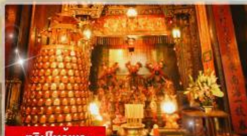
ทริบไหวพร: