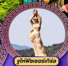
จูไห่พิงเซอร์กิส