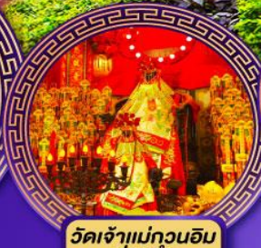
วัดเจ้าแม่กวนอิม ฮ่องฮ่า