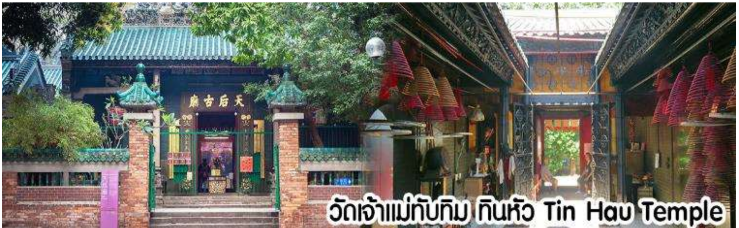
วัดเจ้าแม่ทับทิม ทินหัว Tin Hau Temple

นำทุกท่าน ไหว้ศาลเจ้าแม่ทับทิม ทินหัว (Tin Hau Temple) เป็นวัดเก่าแก่และสำคัญอีกวัดหนึ่งของฮ่องกง เพราะในสมัยก่อน ฮ่องกงเป็นเพียงหมู่บ้านชาวประมง ซึ่งเคารพนักคือเจ้าแม่ทับทิมว่าเป็นเทพีแห่งท้องทะเล เพื่อให้เดินทางปลอดภัย เวลาออกไปทำงานไกลๆ หรือออกหาปลา นอกจากการมาสักการะบูชาเจ้าแม่ทับทิมในเรื่องของการเดินทางให้ปลอดภัยแล้ว ไฮไลท์สำคัญอีกอย่างหนึ่งของวัดเจ้าแม่ทับทิม ทินหัว (Tin Hau Temple) จะเป็นขดรูปสี่แดงขนาดใหญ่ ที่แขวนอยู่ตามเพดานด้านบนของวัดก็จะเป็นสกาปัตยกรรมแบบวัดจีน สร้างขึ้นตั้งแต่ปี ค.ศ. 1876 โดยทางเข้าของวัดจะอยู่ติดกับสวนสาธารณะเล็ก ๆ ที่มีต้นไม้ใหญ่หลายต้น ให้บรรยากาศร่มรื่น