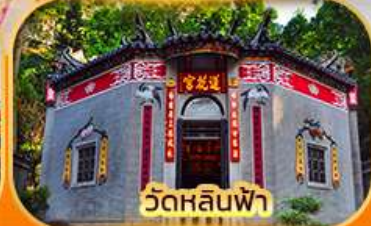
วัดหลินฟา