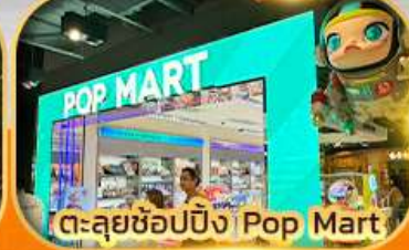
ตะลุยช้อปปิ้ง Ping Pop Mart