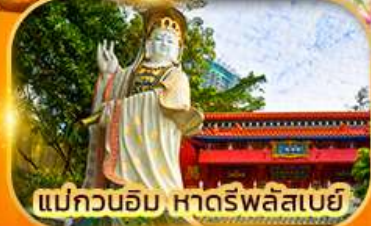
แม่กวนอิม หาดรีพลัสเบย์