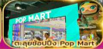
ตะลุยช้อปปิ้ง Pop Mart