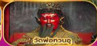
วัดพ่อกวนจู