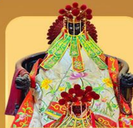
เจ้าแม่กวนอิมสองขำ