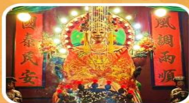
วัดเจ้าแม่กวนอิมเทียนหัว