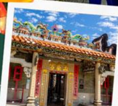
วัดปักไต้