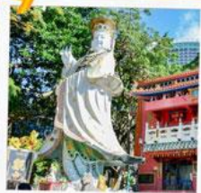
เจ้าแม่กวนอิมรพัสลัมย์

23 กุมภาพันธ์ 2568 วันเยี่ยมเงินเจ้าแม่กวนอิม วัดสองอำ