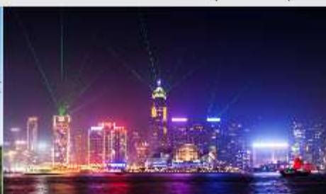
Symphony of Lights