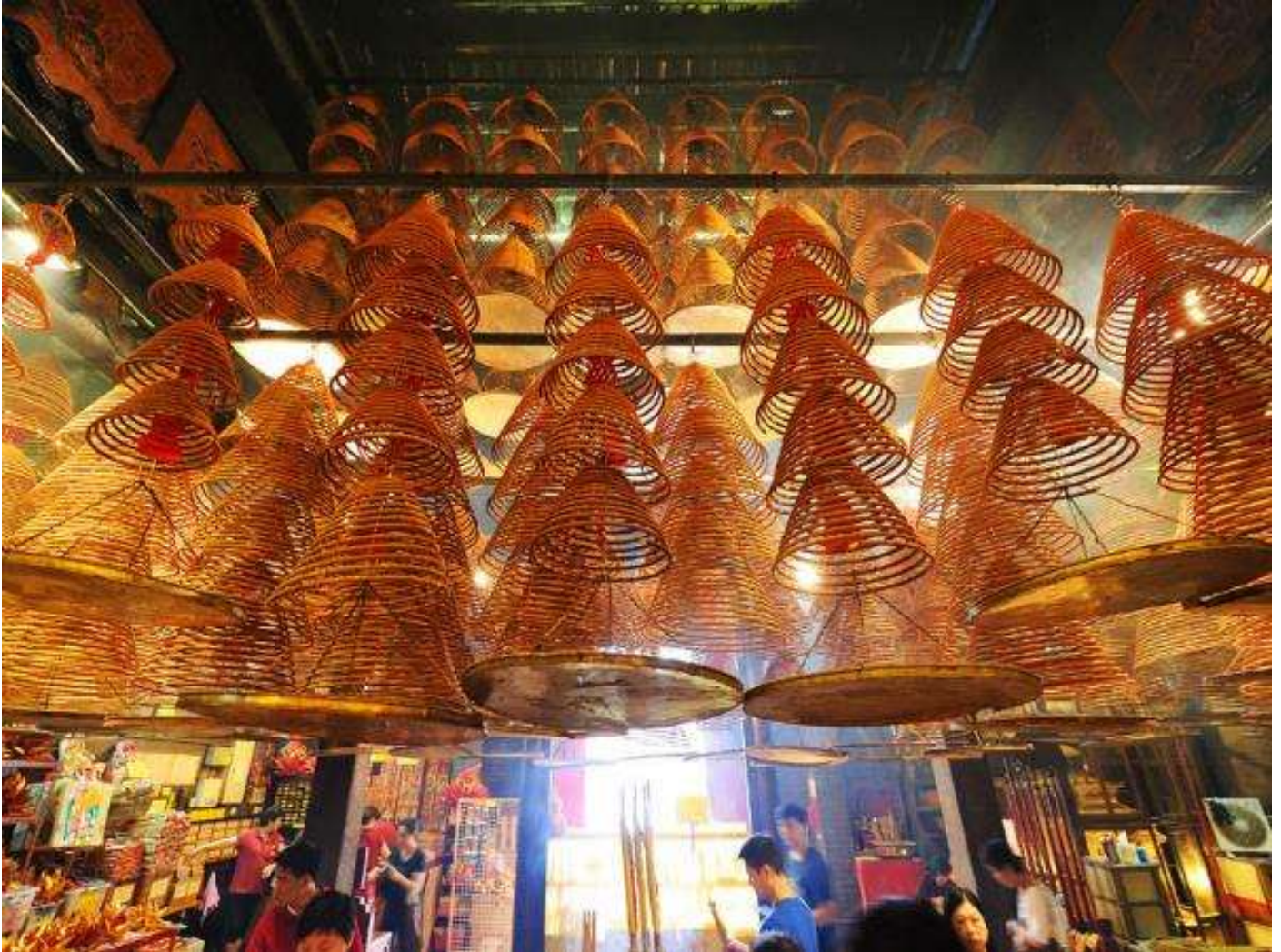
เขาปลอดภัยจากภัยพิบัติ อันตรายต่าง ๆ

นำท่านเดินทางสู่ วัดเจ้าแม่กวนอิมฮ่องกง เป็นวัดที่มีชื่อเสียงมากที่สุดของฮ่องกง และถูกสร้างขึ้นในปี พ.ศ. 2416 (ค.ศ.1873) ขณะที่คนงานก่อสร้างกำลังขุดในพื้นที่ที่เป็นเนินเขา ปรากฏว่ามีน้ำสีแดงไหลออกมาจากพื้นดิน ลึกลับกว่าคือเส้นเลือดของมังกรที่อาศัยอยู่ในพื้นที่ดังกล่าวถูกฉีกขาดเนื่องจากการก่อสร้างขุดเจาะ คนงานเกิดกลัวที่จะดำเนินการก่อสร้างถนนต่อไป จึงเกิดการบริจาคเงินเพื่อบูรณะวัดขึ้นมาด้วยความเชื่อว่าใน เจ้าแม่กวนอิม จะสามารถช่วยให้พวกเขา