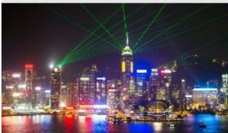
Symphony of Lights