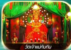
วัดเจ้าแม่ก๊นทิม