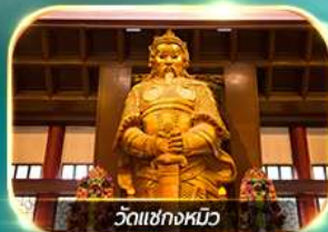
วัดเขangkงม๊ว