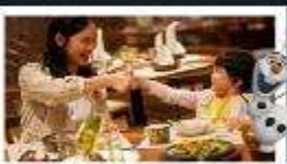
อาหารเข้าในห้องพักดิสนีย์