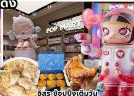
อิสระช้อปปิ้งเต็มวัน ตามเก็บร้านดัง ของเล่นสุดฮิต POPMART