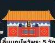
รับบุญไหว้พระ 5 วัด