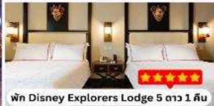
พัก Disney Explorers Lodge 5 ดาว 1 คืน