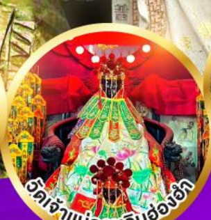
อิตเจ้าแม่กวนอิมฮ่องฮัก