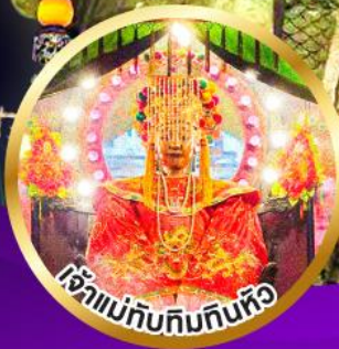
เจ้าแม่ทับทิมกินหัว