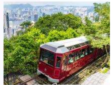
รถรางพิกแกรม