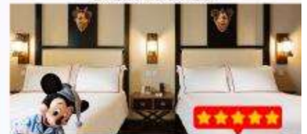
พนัก Disney Explorers Lodge 5 ดาว 1 คืน