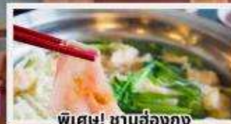
พิเศษ! ชาบูฮ่องกง