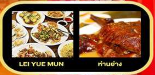
LEI YUE MUN