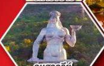
อนุสาวรีย์