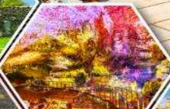
ด้าไฟรมีริอุส