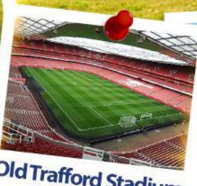
Old Trafford Stadium