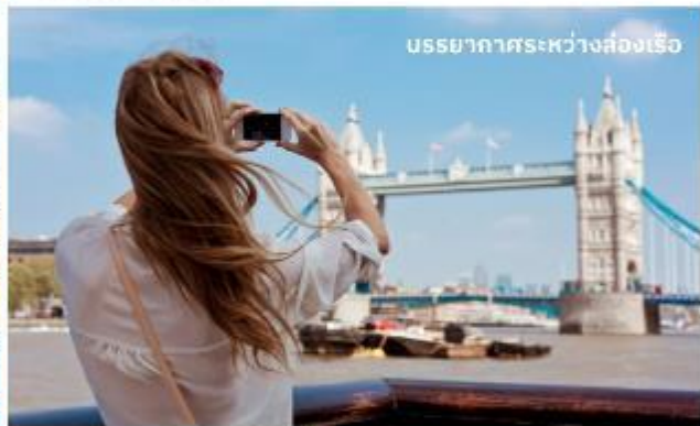
บรรยากาศระหว่างส่องเรือ

ชมทิวทัศน์งดงามของสองฝากฝั่งแม่น้ำเทมส์ ซึ่งไหลผ่านกลางกรุงลอนดอน ส่องเรือผ่านสถานที่สำคัญต่างๆ เช่น จัตุรัสรัฐสภา, พระราชวังเวสต์มินสเตอร์, ลอนดอนอาย, กาวเวอร์ออฟลอนดอน และ กาวเวอร์บริดจ์