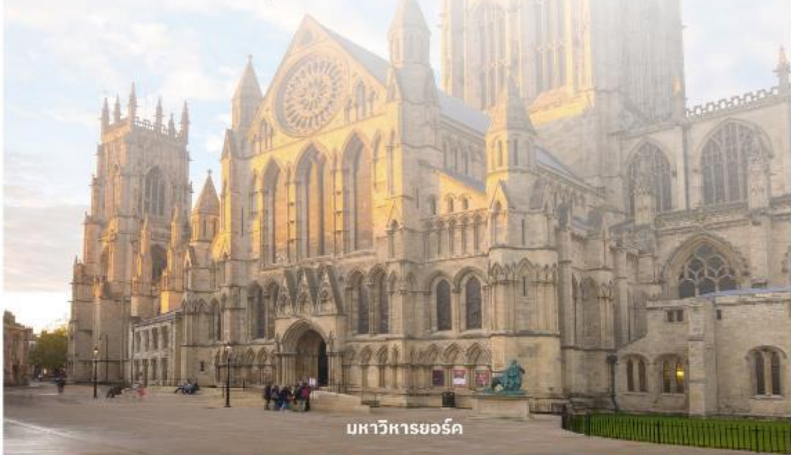
มหาวิหารยอร์ก

จากนั้นนำท่านเดินต่อไปที่ The Shambles (เดอะแซมเบิล) เป็นสถานที่ที่มีความคล้ายกับตรอกไดอากอนในภาพยนตร์ชื่อดังอย่าง Harry Potter อีสระให้ท่านเดินเลือกซื้อของที่ระลึกตามอัธยาศัย