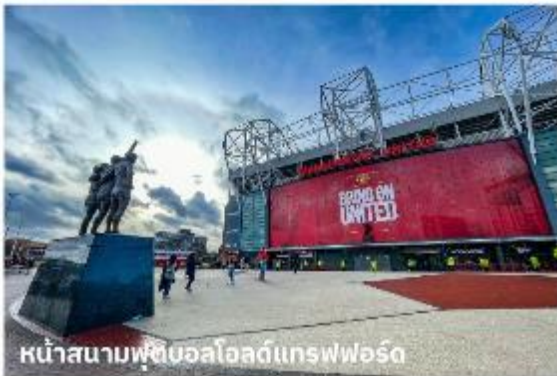
หน้าสนามฟุตบอลโอลด์แทรฟฟอร์ด