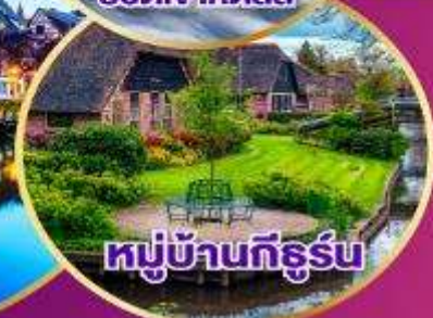
หมู่บ้านทีธูร์น