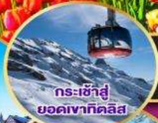
กระเช้าสู่ยอดเขาคิลิส