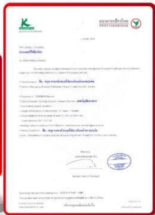
ตัวอย่าง Bank Guarantee ที่ผู้สมัครต้องขอจากธนาคาร