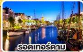
รอดเทอร์ดาบ