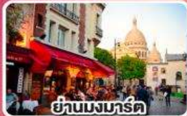
ย่านมงมาร์ต