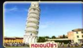
ทอเอนปีซ่า