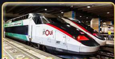
นั่งรถไฟความเร็วสูง PARIS - LYON

📅 เดินทาง : 05-14 เม.ย. 68 | 29-08 พ.ค. 68