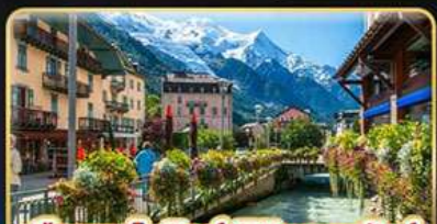
เยือนซาโมนิซซ์ พิชิตมงบลังก์