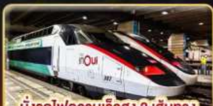
นั่งรถไฟความเร็วสูง 2 เส้นทาง PARIS - LYON & VENICE - ROME

📅 เดินทาง : 11-20 ก.พ. 68 / 15-24 มี.ค. 68 05-14 เม.ย. 68 / 29-08 พ.ค. 68