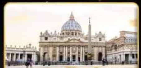
เซนต์ปีเตอร์