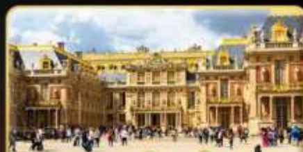
พระราชวังแวร์ซาย