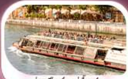
คองเรือชมแม่น้ำแซน