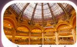
ห้างแลuvreคอฟ้าแซตต์