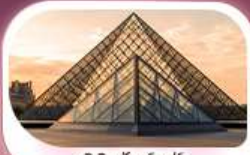
พิพิธภัณฑ์ลูฟร์