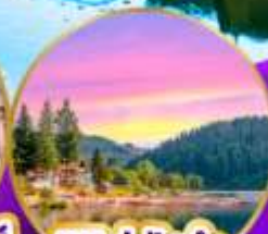
ทิทิเซ่ ปาด่า