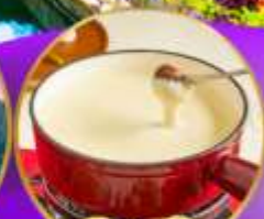
ฟองดูซีส