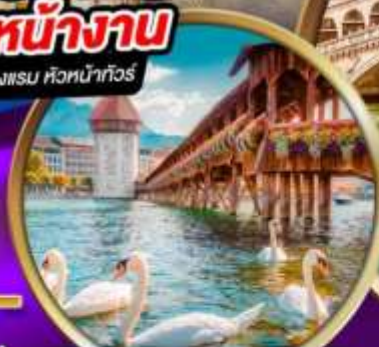
สะพานไม้ ซาเปลา