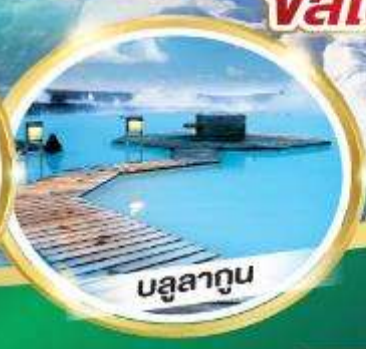
บรูสาอุน