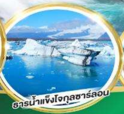
ธารน้ำแข็งโจกุลซาร์ลอน