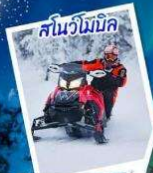
สโนว์โมบิล