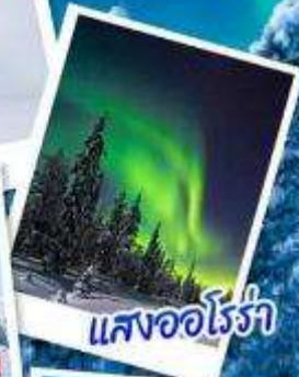
แสงออโรรา