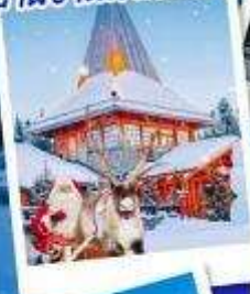
หมู่บ้านซานตาคลอส