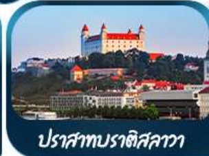
ปราสาทบราติสลาวา