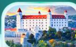
ปราสาทปราตีสลวา

เที่ยวชมเมืองออสเตรียที่หมู่บ้านริบะเลสาบสวยที่สุดในโลก พระราชวังเชินบรุนน์ เมืองลินซ์ จิตรกรรมฝาผนังที่ สันติเมืองมรดกโลก เซสกี ครอบงม เยี่ยมชมปราสาทปราก ถนนทองคำ เช็คอินสถานที่ชื่อดัง! ปราสาทปราตีสลวา ส่องเรือชมความงามแม่น้ำดานูบ แม่น้ำที่ยาวที่สุดในยุโรป ชมความน่าหลงใหลของ ปราสาทบูคาเปสต์ สะพานชาร์ลส์