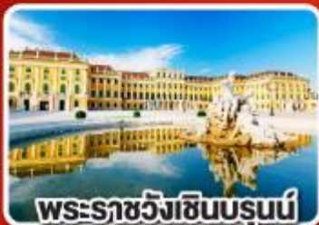
พระราชวังเชินบรุนน์